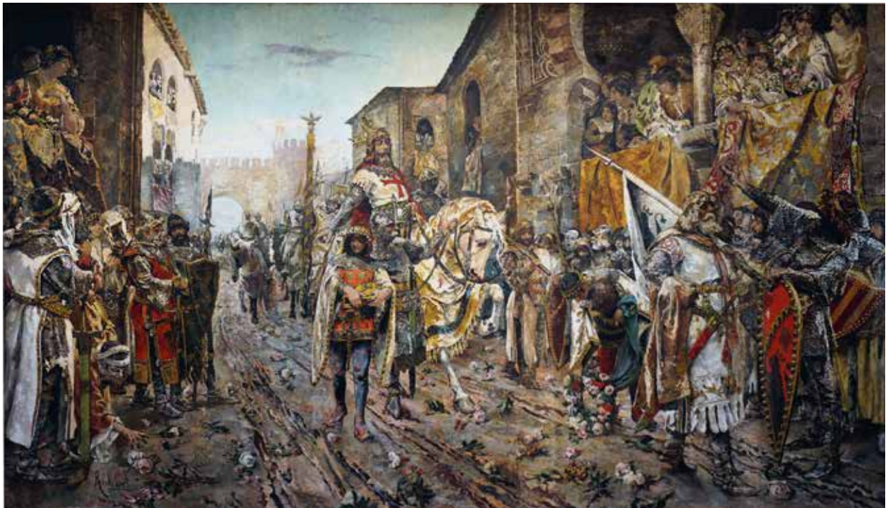
Entrada triunfal en Valencia del rey don Jaime I el Conquistador (año 1238)