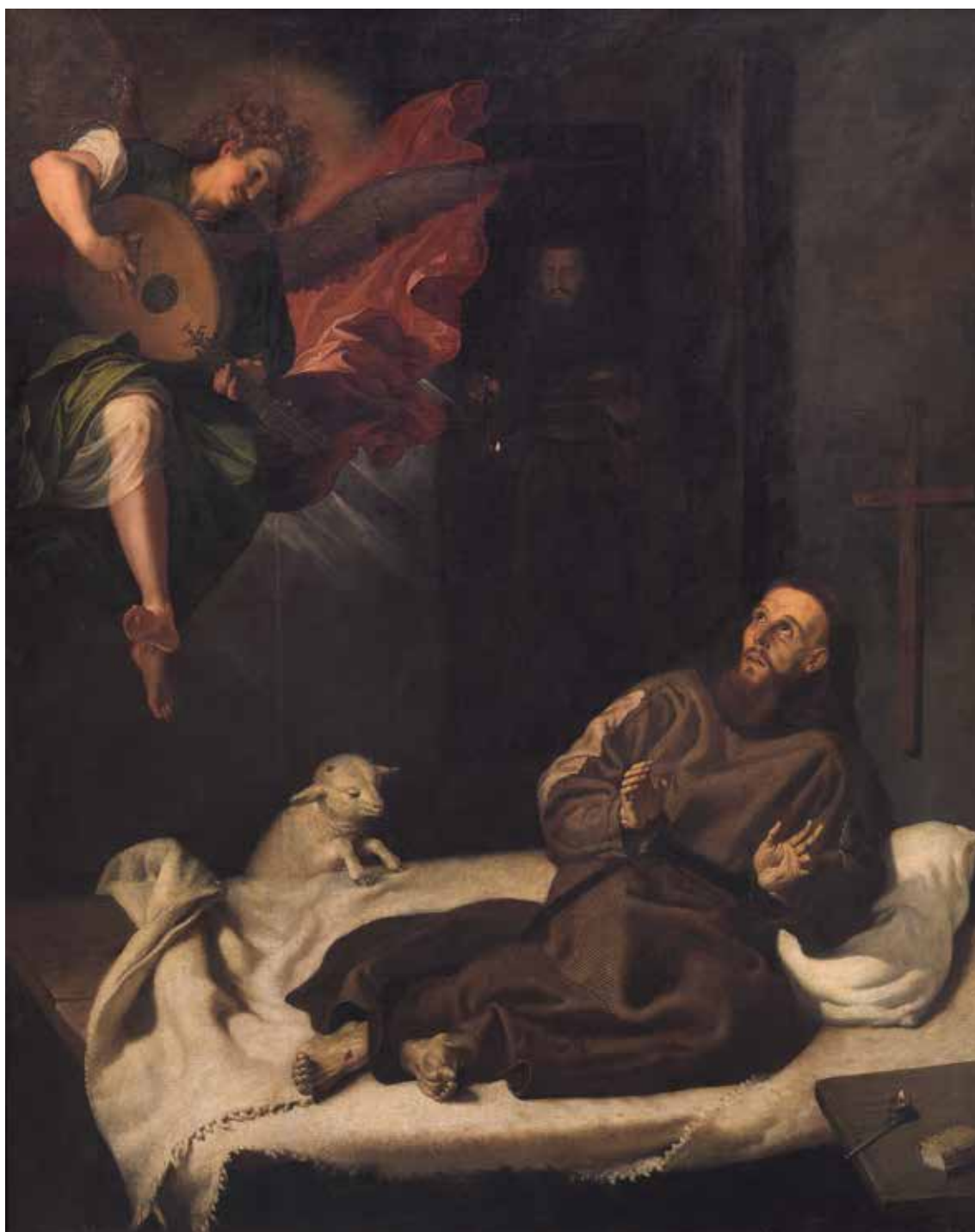
RIBALTA, Francisco San Francisco confortado por un ángel músico

Hacia 1620 Óleo sobre lienzo Alto: 204 cm; Ancho: 158 cm Sala 007A