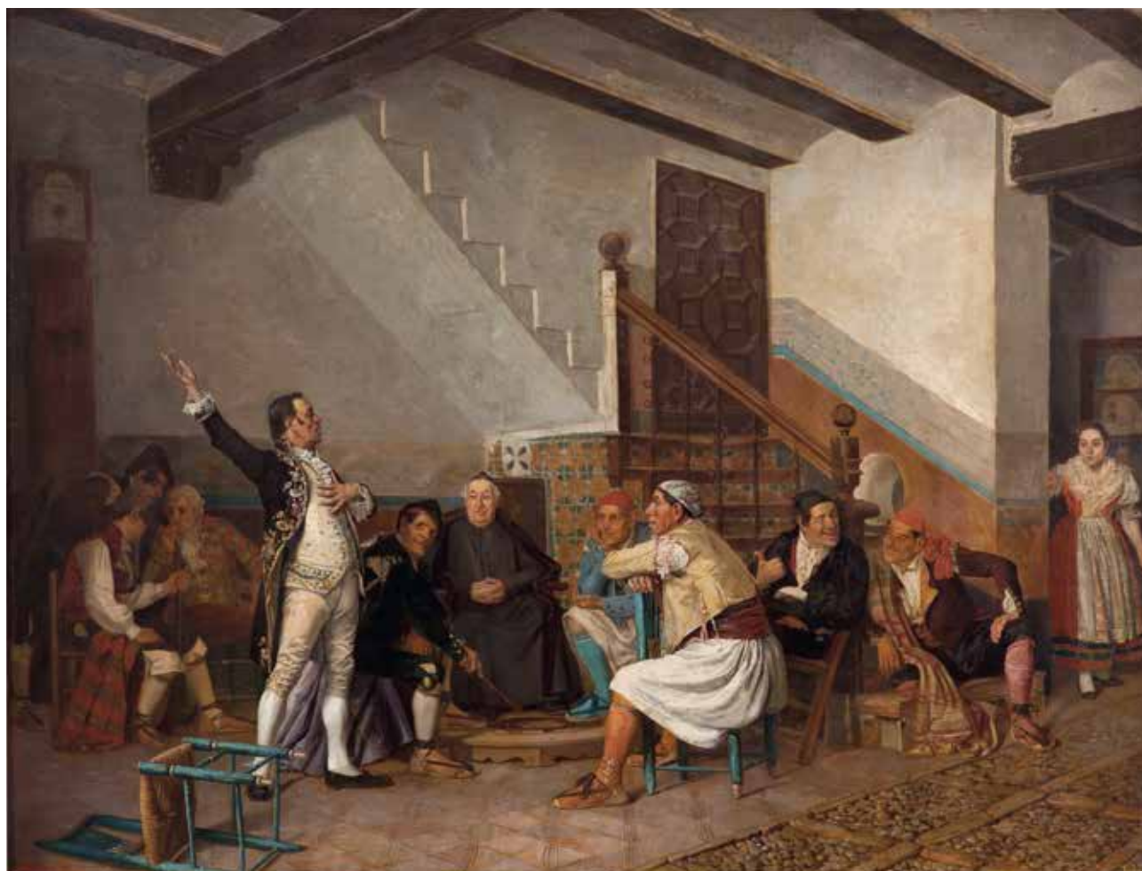
Nombradme y se salva la patria o El charlatán político