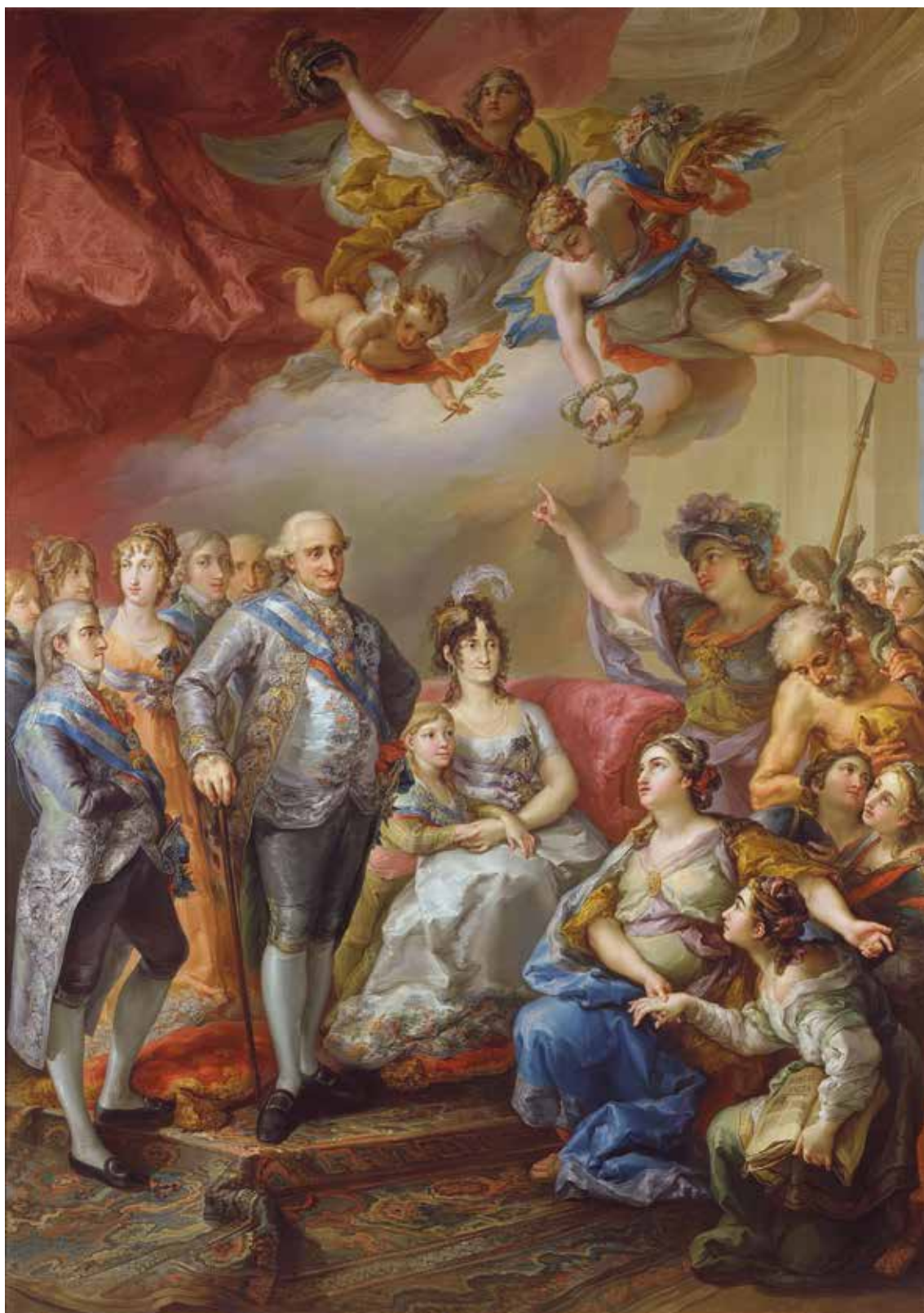
Carlos IV y su familia homenajeados por la Universidad de Valencia