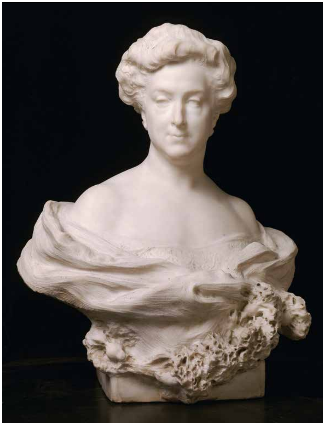
BENLLIURE, Mariano Faustina Peñalver y Fauste, marquesa viuda de Amboage 1914 Mármol de Carrara Alto: 73 cm; Ancho: 60 cm; Fondo: 42 cm; Peso: 143,6 kg Sala 060A