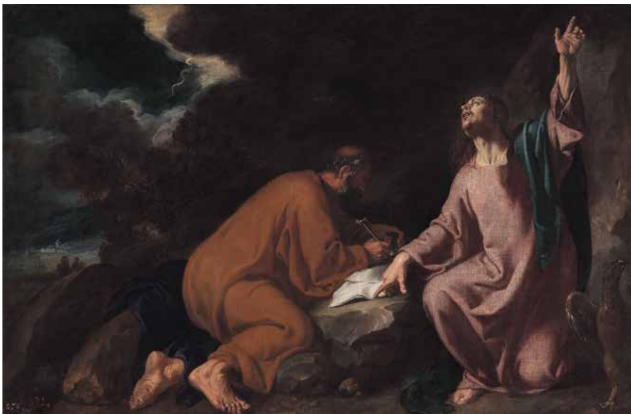
RIBALTA, Juan San Mateo y san Juan Evangelista Hacia 1625 Óleo sobre lienzo Alto: 66 cm; Ancho: 102 cm