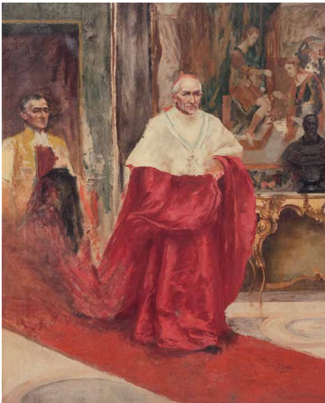
BENLLIURE, José Cardenal 1880-1885 Óleo sobre lienzo Alto: 62,5 cm; Ancho: 50,5 cm