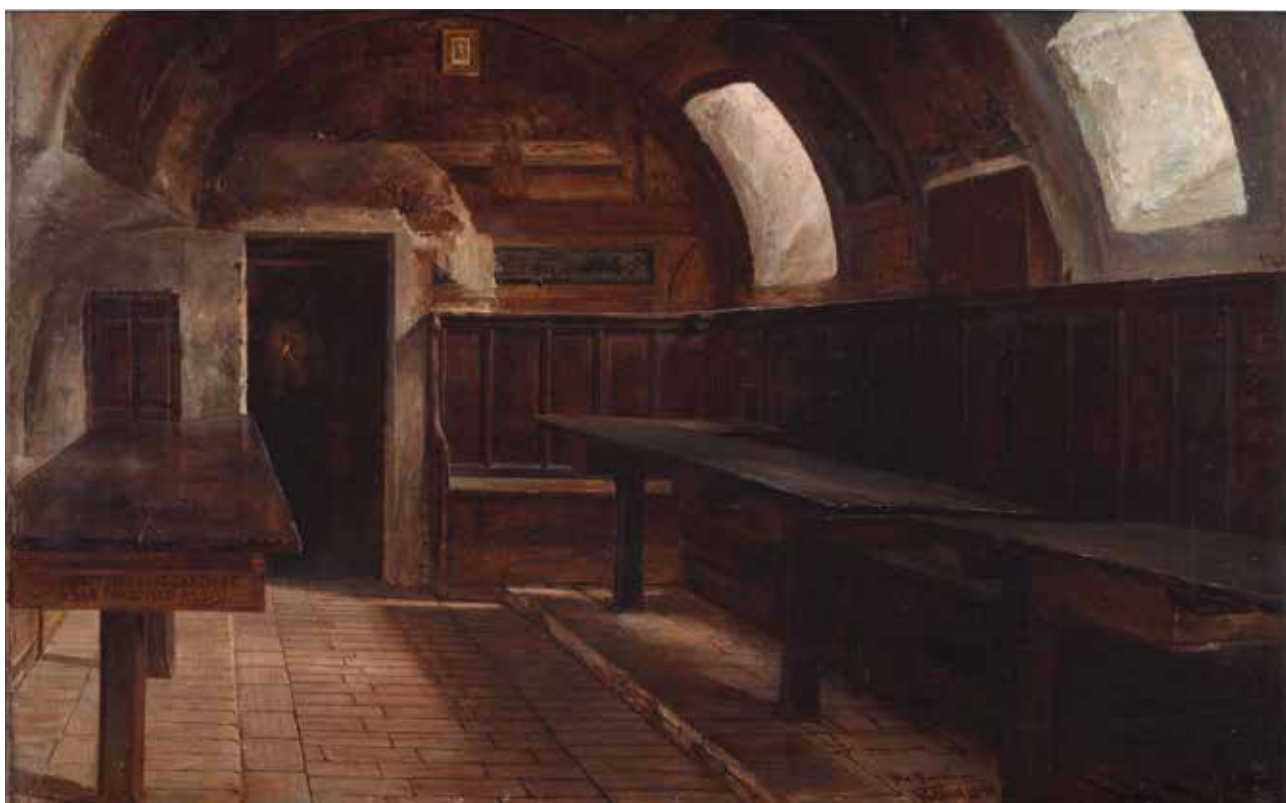
BENLLIURE, Blas Refectorio de las Cárces de San Francisco de Asís 1890 Óleo sobre lienzo Alto: 45 cm; Ancho: 71 cm Valencia - Museo de Bellas Artes de Valencia (Depósito)