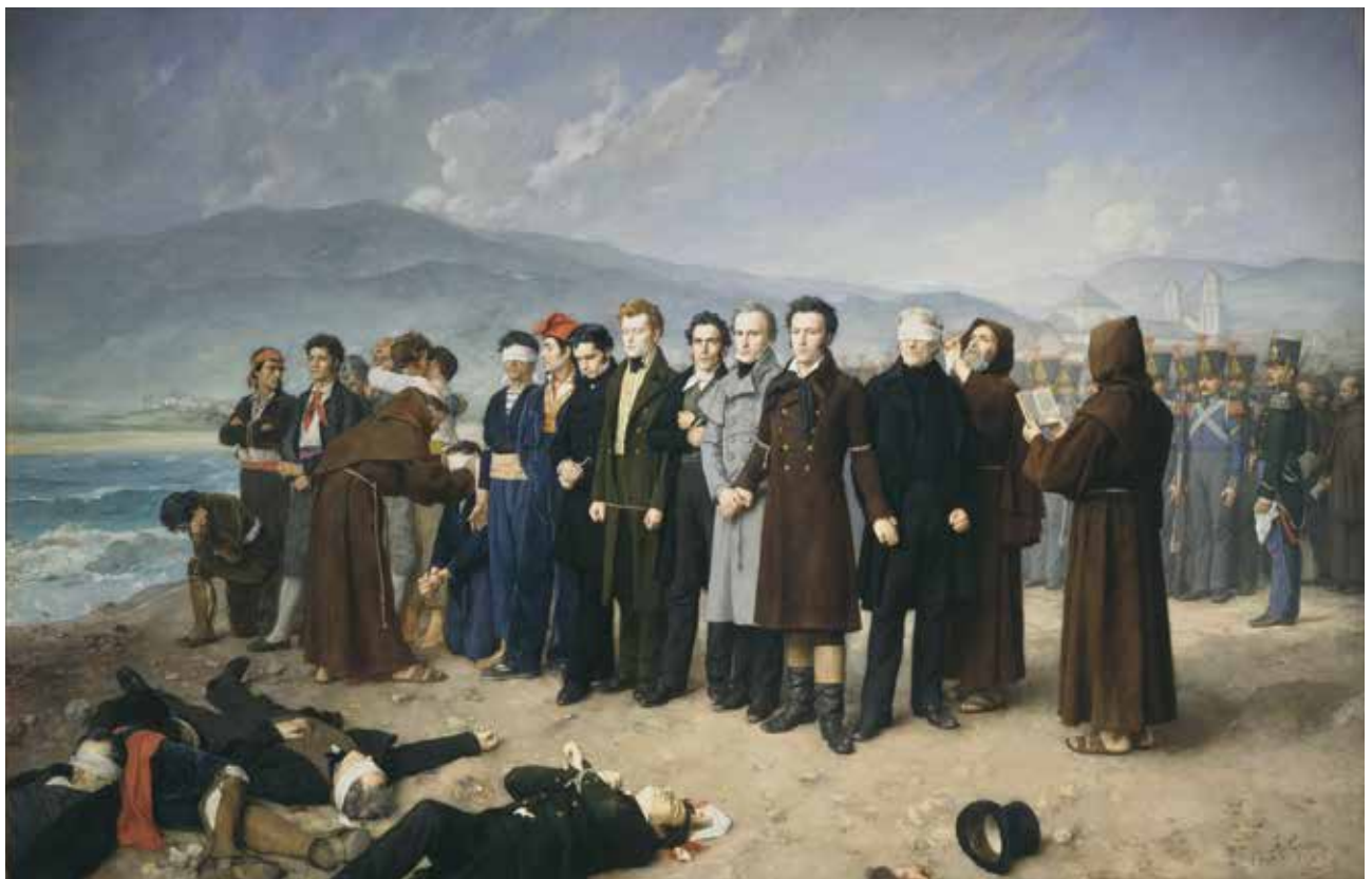
El Fusilamiento de Torrijos y sus compañeros en las playas de Málaga

Durante sus últimos años en Francia, realizó cuadros de fácil venta, muy del gusto de la burguesía francesa hasta su fallecimiento en 1901.