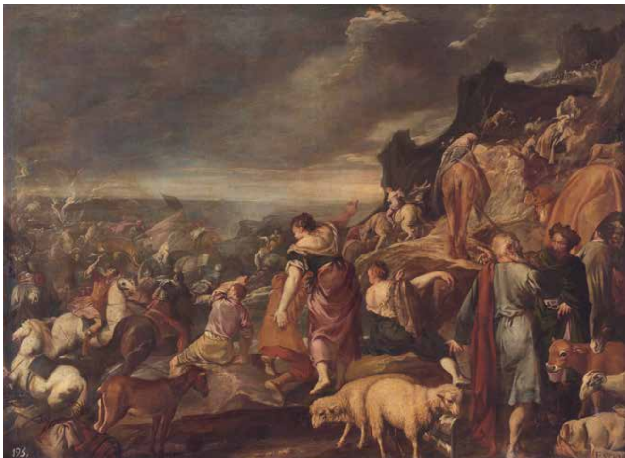
MARCH, Esteban El paso del mar Rojo Siglo XVII Óleo sobre lienzo Alto: 129 cm; Ancho: 176 cm