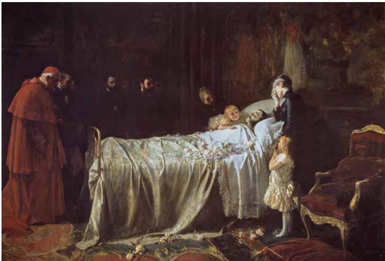
BENLLIURE, Juan Antonio Muerte de don Alfonso XII (El último beso) 1887 Óleo sobre lienzo Alto: 300 cm; Ancho: 400 cm Barcelona - Palacio de Pedralbes (Depósito)