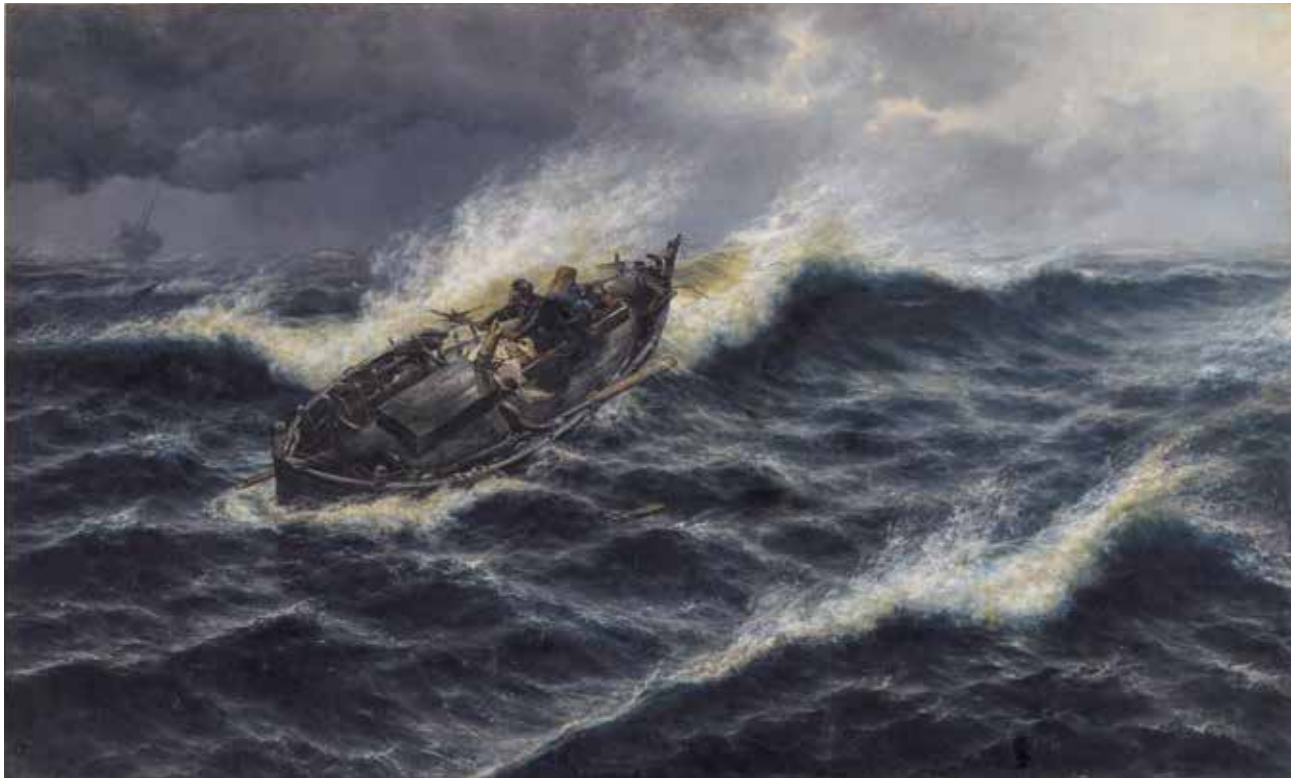
En alta mar o A la deriva 1887 Óleo sobre lienzo Alto: 250 cm; Ancho: 400 cm Museo de Bellas Artes de Valencia (Depósito)