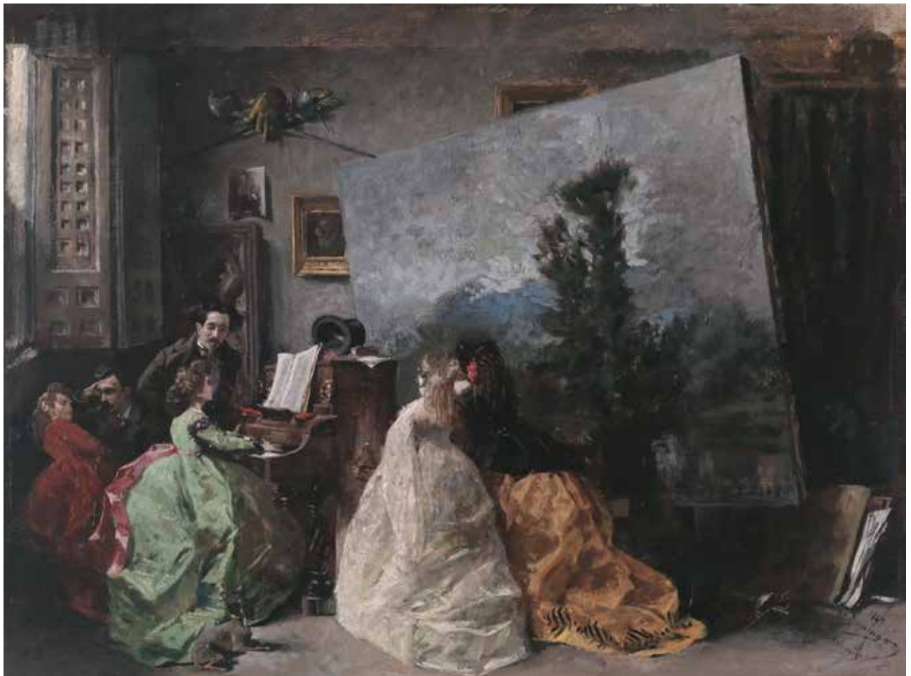
Interior del estudio de Muñoz Degrain en Valencia

1867 Óleo sobre tabla Alto: 38 cm; Ancho: 50 cm