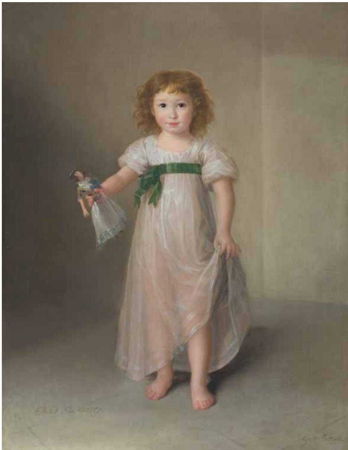
Manuela Isidra Téllez-Girón, futura duquesa de Abrantes